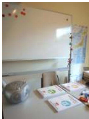
アットホームな教室 (通学の場合)