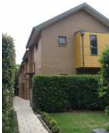
WJLC の学校の概観 (シドニー近郊)